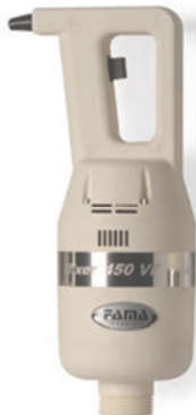
MIXER 450 VF