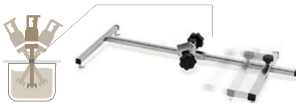
FSP Supporto pentola regolabile e con snodo libero Adjustable pot support with free articulated joint