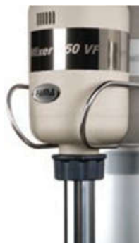
FSPS Supporto parete singolo Single wall support

lame in acciaio INOX acili da smontare / steel blades easy to disassemble