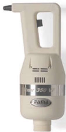
MIXER 350 VF

La tecnologia SRS consente di ottenere composti estremamente omogenei. SRS device grants high-quality homogeneous mixtures.