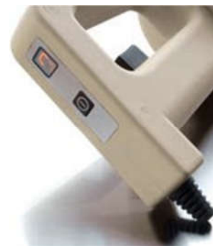
Display luminoso con tasto di avvio Luminous display with start button